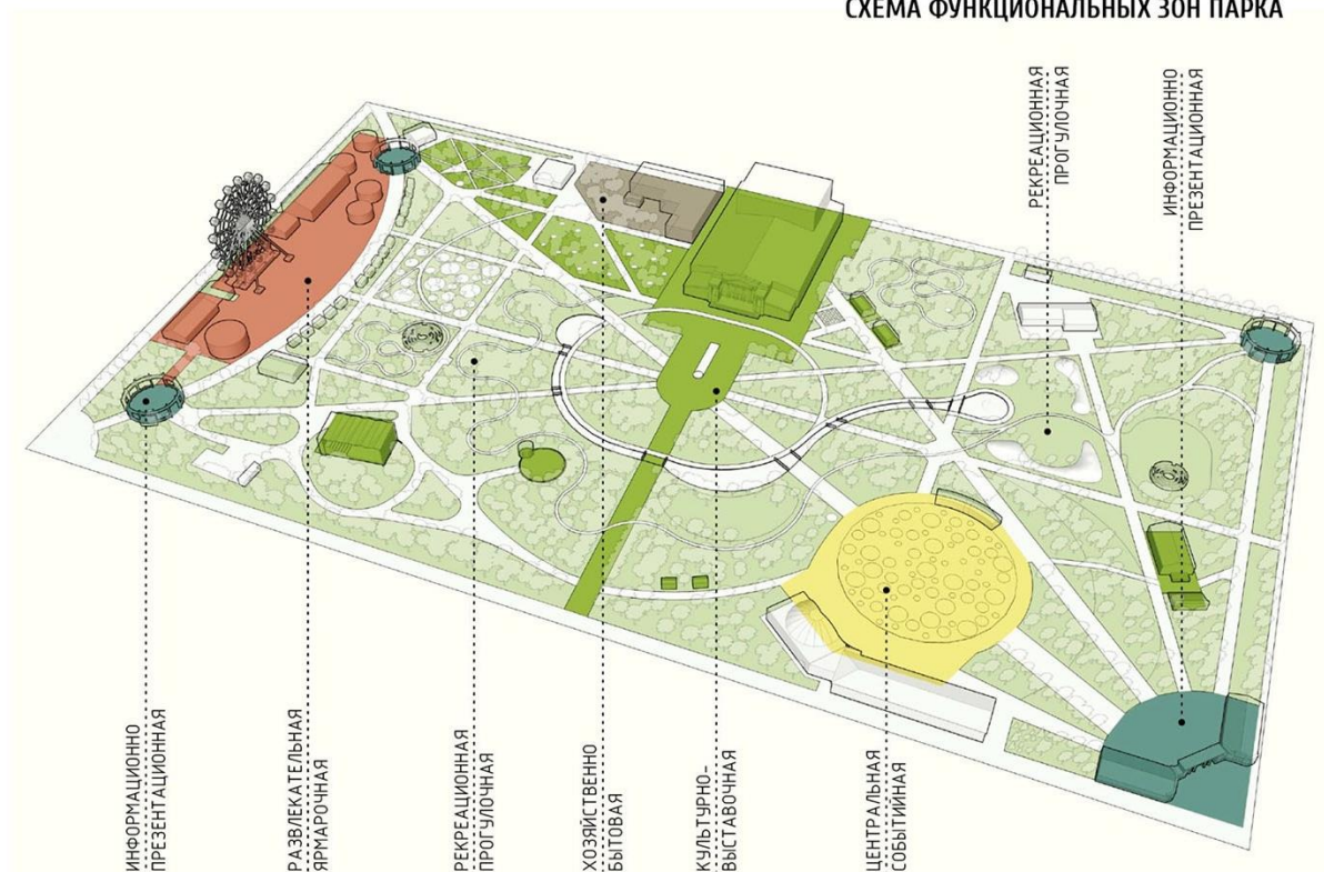
СХЕМА ФУНКЦИОНАЛЬНЫХ ЗОН ПАРКА

Ответ: для рекреационно-прогулочной зоны наиболее подходящим вариантов садово-паркового ландшафта является лесной (создает комфортный микроклимат летом, дает возможность уединения), наилучший вариант – сочетание разных типов лесных СПЛ: широколиственных, хвойных, мелколиственных.